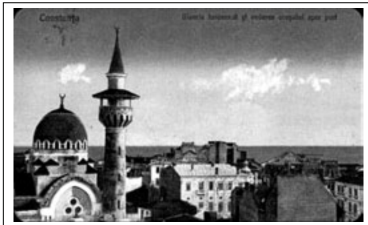
Figura 3.3. Moscheea din Constanța la începutul secolului XX

Numărul estimat al turcilor din România este de 29.080, ceea ce reprezintă 0,13% din populația țării. Aceștia trăiesc în județul Constanța (majoritatea), dar și în Tulcea, București, Călărași, Brăila.