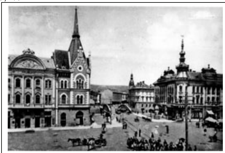
Fig. 2.8. Scenă din centrul Clujului în per- ioada interbelică