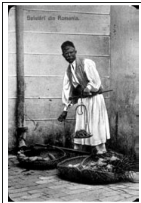
Figura 1.2. Negustor ambulant bulgar (1908)