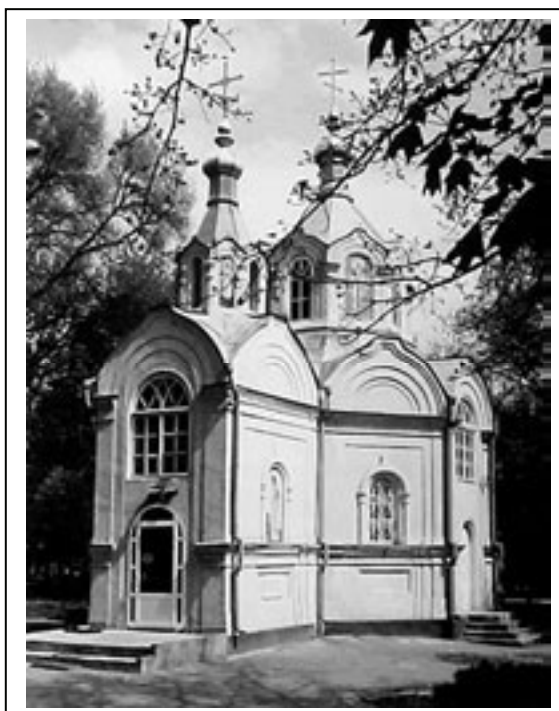
Figura 1.3. Basarabia – paracelis închinat vo-luntarilor bulgari în războiul din 1877-1878

În cadrul organelor locale ale administrației din diferite localități au fost aleși și reprezentanți ai minorității bulgare, care au candidat din partea altor formațiuni politice decât cele două organizații menționate anterior.