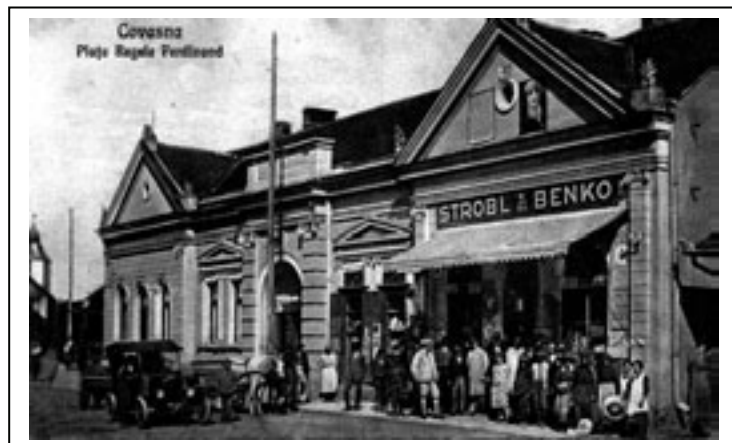
Maghiarii din România în epo- ca comunistă

După al doilea război mondial, Transilvania de nord, răpită României prin dictatul de la Viena, 1940, a revenit României. Dar în scurt timp se instaurează în România ca și în Ungaria regimul comunist. În regimul comunist, datorită unei importante prezențe a maghiarilor în rândurile partidului comunist din România, maghiarii beneficiază de o serie de