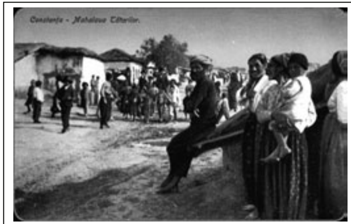
Figura 3.2. Cartierul tătăresc din Constanța

regiunea la sfârșitul secolului XIV-lea. Din acest moment, pentru cinci secole Dobrogea va deveni un teritoriu în care se vor împleti destinele celor două populații înrudite. După ce Hanatul Crimeii, un rest al Hoardei de Aur, a fost anexat de Rusia în 1783, mulți tătarii au migrat în valuri succesive în Imperiul Otoman. Aici, în Dobrogea, ei au conferit o nouă dimensiune civilizației de stepă care le era specifică.