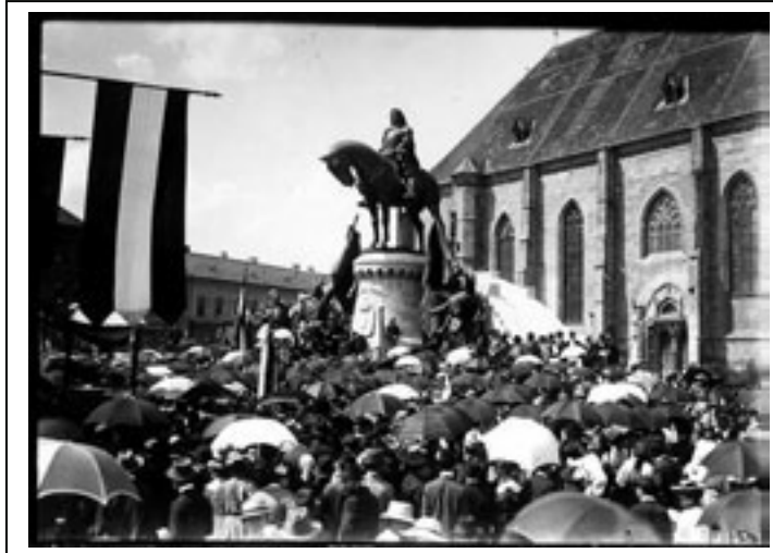
Maghiarii din România în per- ioada interbelică

Sfârșitul primului război mondial aduce destrămarea monarhiei austro-ungare. Românii din fosta monarhie pe baza dreptului popoarelor la autodeterminare își proclamă la 1 decembrie 1918, hotărârea de unire cu România. Conferința de pace de la Paris din 1919-1920 și tratatul semnat la Trianon, la 4 iunie 1920, au consacrat din punct de vedere al dreptului internațional unirea Transilvaniei cu România.