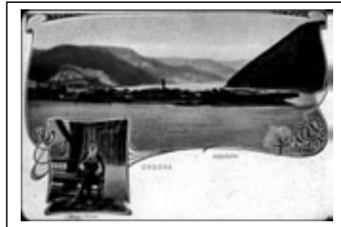
Figura 3.4. , Figura3.5. Imagini ale unei comunități dispă- rute – comunita- tea turcă din Ada- Kaleh

După anul 1990, turcii s-au organizat formând Uniunea Democrată Turcă din România (UDTR), al cărei principal obiectiv este să revigoreze și să transmită valorile culturale și tradiționale ale etnicilor turci. UDTR - filiala Galați a organizat un festival interetnic euroregional "Dunărea de jos" și coordonează activitatea editurii Elvan. UDTR editează ziarul Hakses și numai în anul 2000 a publicat patru volume. Conform recensământului din (1992), numărul estimat al turcilor din România este de 29. 080, adică 0,13% din populația României. Dintre aceștia 24.295 trăiesc în județul Constanța, 3 390 în Tulcea și restul în București, Călărași și Brăila.