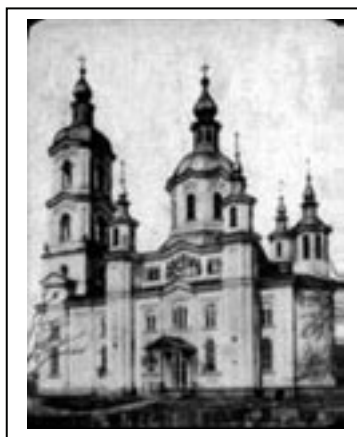
Figura 2.10. Biserica lipove- nească din Galați