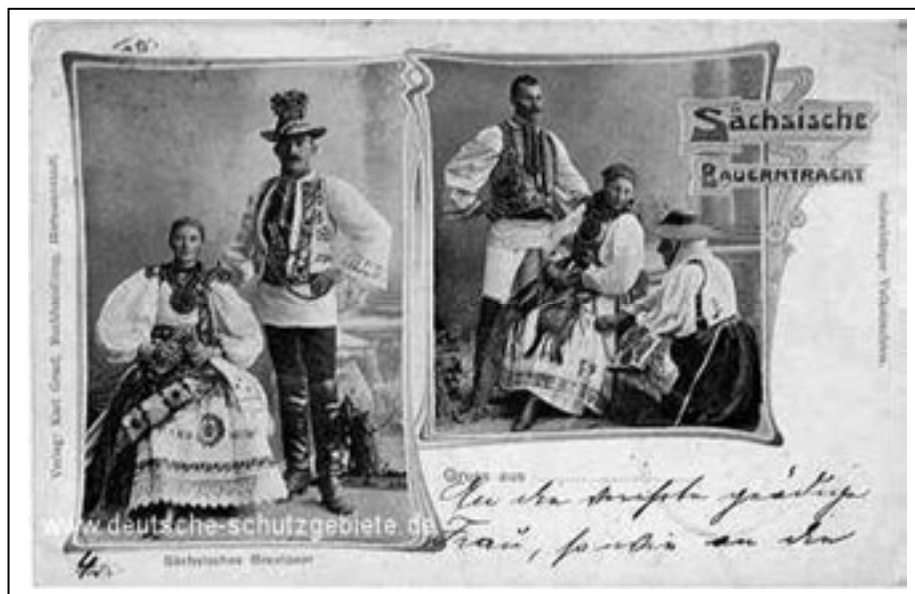
Figura 1.6. Costume populare săsești la începutul secolului XX