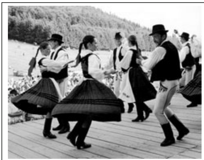
Figura 2.6. Festival folcloric al maghiarilor din România