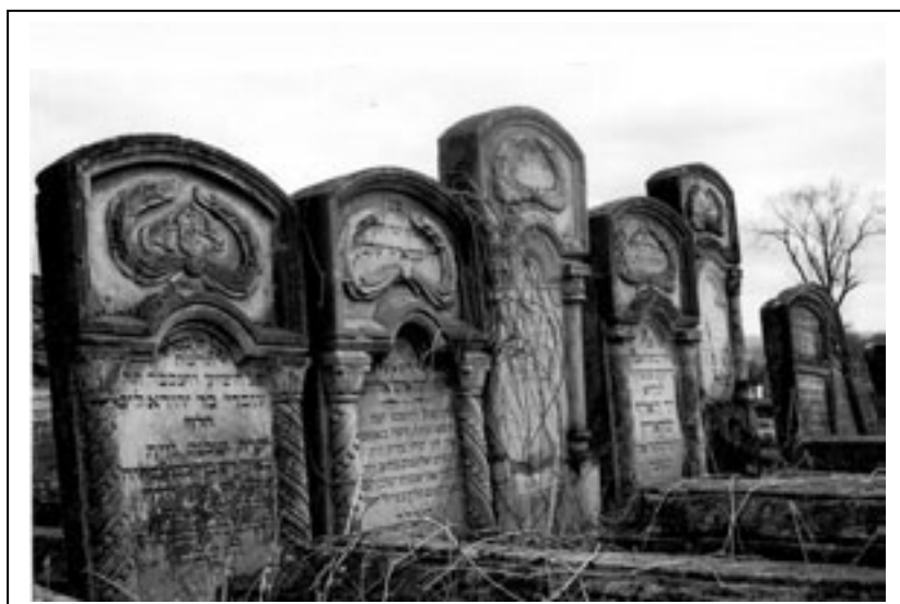
Figura 2.3. Cimitirul evreiesc din Iași

Dezamăgirea față de noua dictatură, ca și apariția după război a statului Israel au determinat reorientarea evreilor din România spre emigrare, ceea ce conduce la o scădere drastică a numărului lor. La 1956 avem 146 264 de persoane, iar în 1977 cifra se reduce drastic la doar 24 667 de persoane.