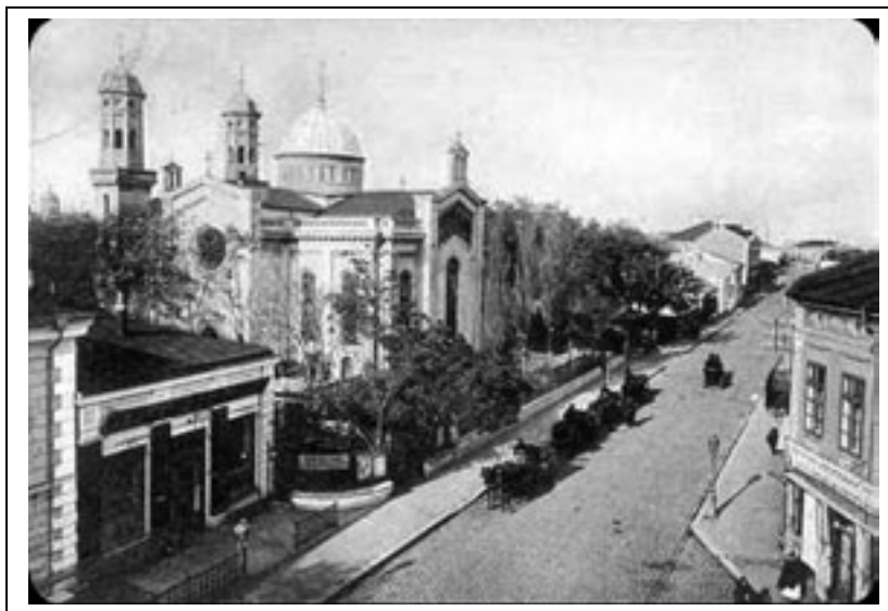
Figura 2.5. Biserica Gre- cească din Galați la începutul se- colului XX

greacă din România în veacul al XIX-lea" de Olga Cicanci. UER a reușit, după 1990, să redobândească mai multe dintre proprietățile confiscate de regimul comunist, dintre care amintim Teatrul "Elpis" din Constanța sau Cinematograful Elen și Restaurantul "Olimp" din Galați.