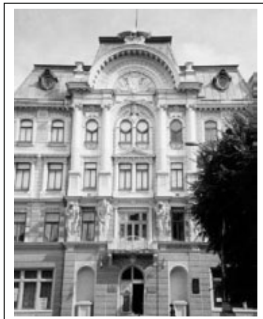
Figura 2.2. Casa iudaică din Cernăuți

În cele două principate situația se prezintă cam la fel. Astfel la 1774 în Moldova recensământul efectuat de autoritățile rusești atestă un număr de 1300 familii evreiești, cu prezențe mai importante la Iași, Suceava, Cernăuți, Hotin, Botoșani. La 1838 populația evreiască crescuse destul de mult, sursele atestând 79 164 de persoane. Spor natural, dar și o puternică emigrație din Galiția și teritoriile poloneze și Rusia. La 1860 numărul evreilor din Moldova este de 124 897 de persoane și doar de 9234 în Tara Românească. În Basarabia, devenită rusească, numărul evreilor era la aceeași dată de 78 751. Până la sfârșitul secolului numărul evreilor din România se dublează, ajungând la cifra de 269 015, ca să regreseze în preajma primului război mondial la 239 967 de persoane, datorită emigrărilor și dezbaterilor aprinse cu privire la obținerea cetățeniei și naturalizarea lor.