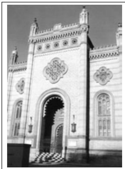
Figura 2.1. Templul coral din București

Începuturile istoriei evreilor din România se pierd învăluite între istorie și legendă. Primele atestări documentare ale prezenței lor le avem din perioada Daciei romane, când cu siguranță printre coloniștii sau trupele aduse în Dacia „din toată lumea romană” avem și evrei din provincia Palestina.