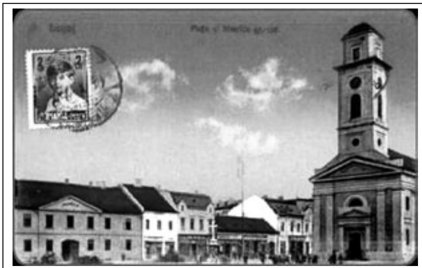
Figura 1.4. Piața centrală din Lugoj în perioada interbelică