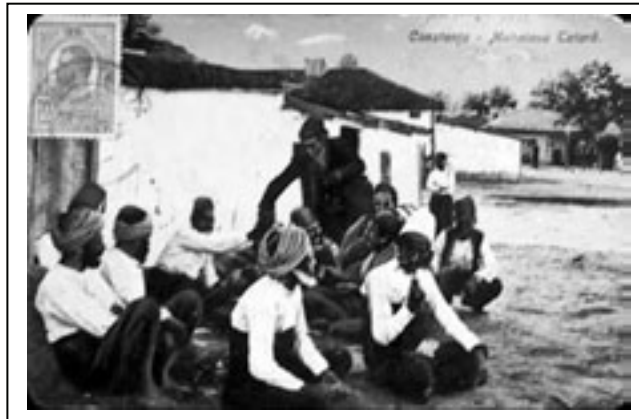
Figura 3.1. Cartierul tătăresc din Constanța în perioada interbelică

Numărul estimat al tătarilor din România este de 24.649, ceea ce reprezintă 0,11% din populația țării. Aceștia trăiesc în județele Constanța, Tulcea și în municipiul București.