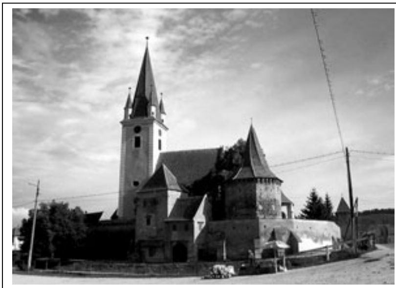
Figura 1.5. Biserica săsească din Cristian